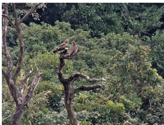
第 83 號巢常停棲的枯木