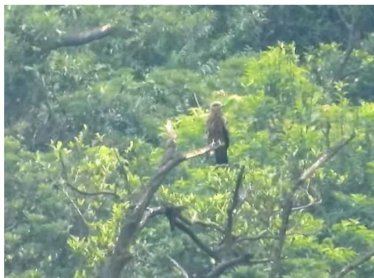
第 41 號巢幼鳥