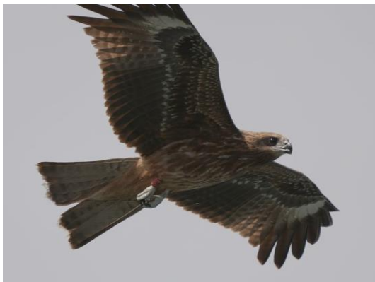
20211116 黑鳶幼鳥 K9