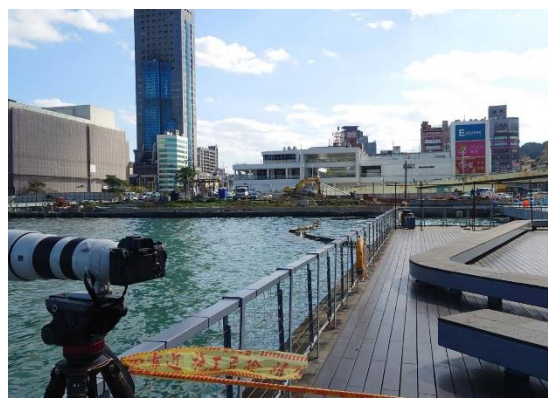
20211205 旭川河工程仍截流中