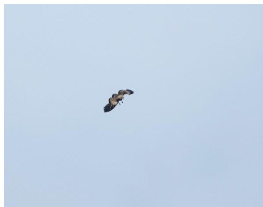
第 56 號巢幼鳥