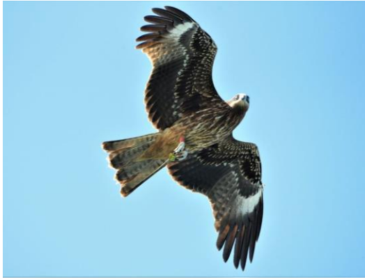
20211105 黑鳶幼鳥 K9