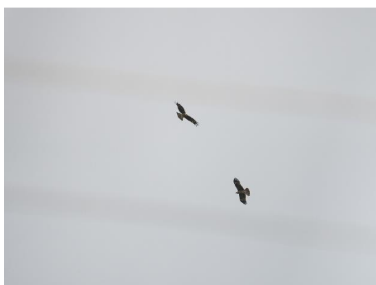
第 56 號巢兩隻幼鳥