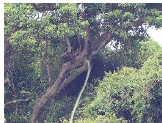
第 78 號巢幼鳥