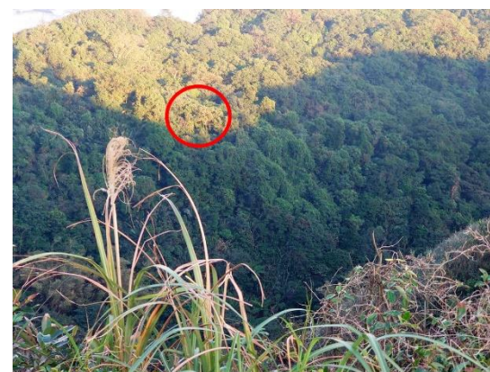
第 83 號巢常停棲的枯木斷掉