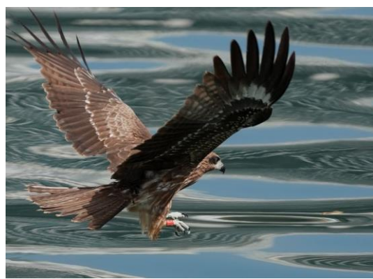
20211116 黑鳶幼鳥 K9