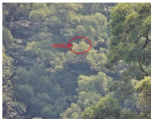
第 56 號巢換巢位