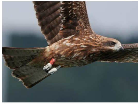
20211116 黑鳶幼鳥 K9