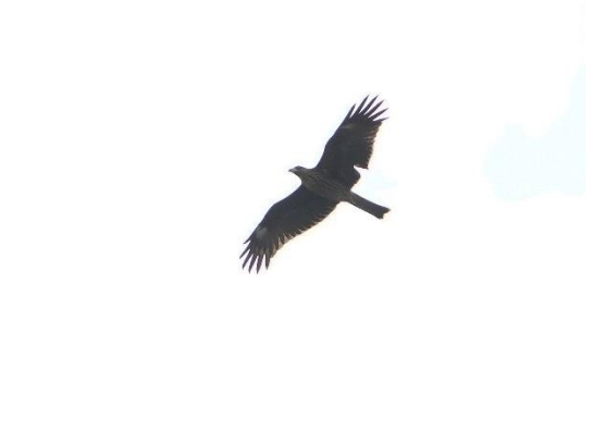
第 45 號巢幼鳥左翅受損的次級飛羽