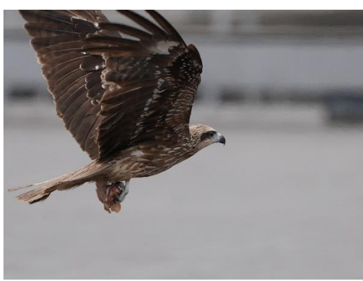
20210517 黑鳶抓走海洋廣場的雞頭