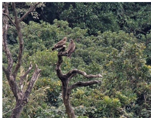
第 83 號公母鳥