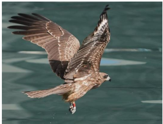
20211116 黑鳶幼鳥 K9