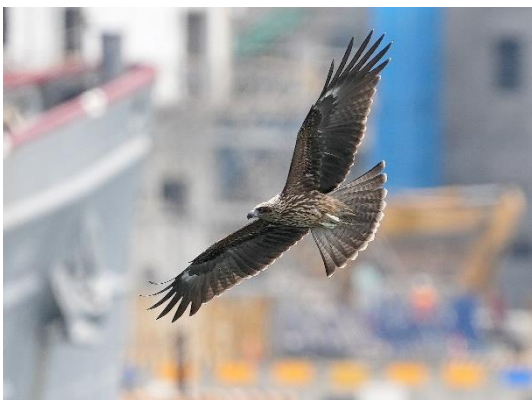
20210614 基隆港的黑鳶幼鳥