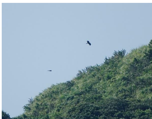
第 61 號巢幼鳥